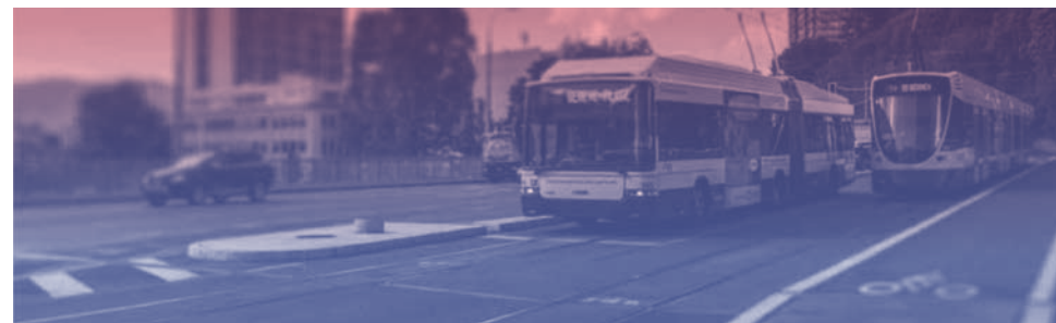
Amélioration de la circulation : Catalogue des mesures ponctuelles 2014, Direction générale des transports

On avait cru au miracle. Il y a 5-6 ans, Genève était la première ville européenne à tester le