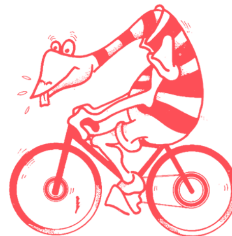
Illustration de l'ASPIC de M. Barranco

Co-fondatrice de l'Association pour des pistes cyclables (ASPIC)