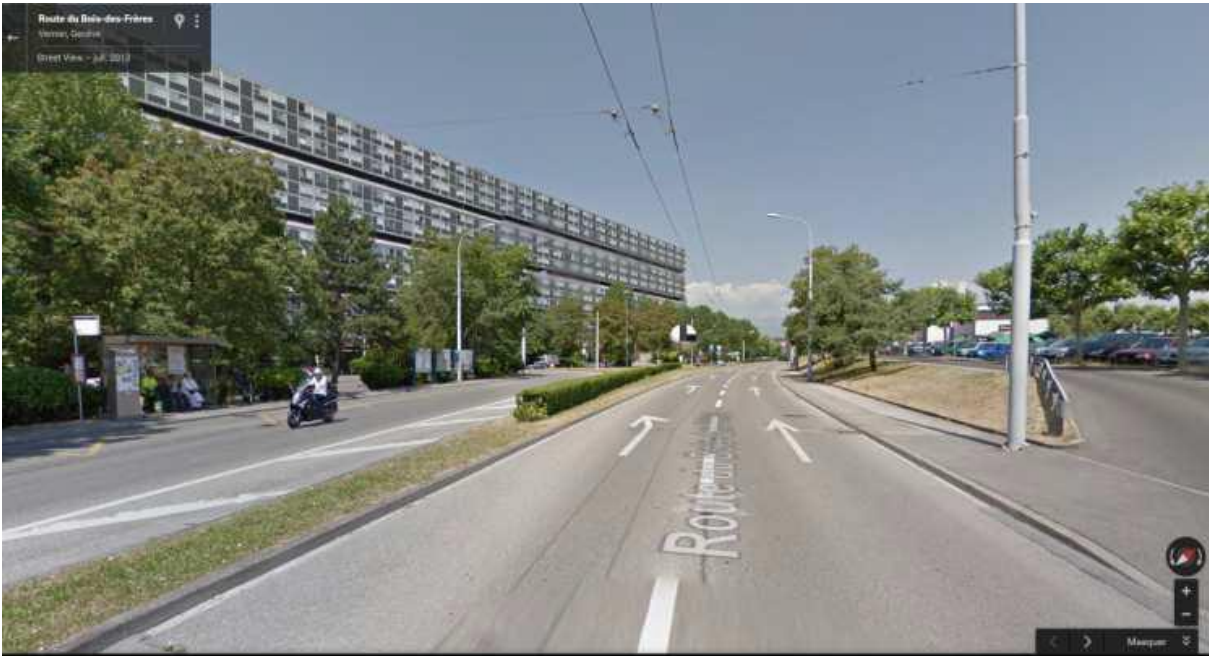
Exemple : Avant (ci-dessus) et après (ci-dessous) les nouveaux aménagements.