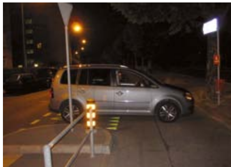
Bien pratique les pistes cyclables pour se garer le soir!

Et le soir, c'est Byzance. Les trottoirs sont envahis de voitures, ne permettant plus le pas-