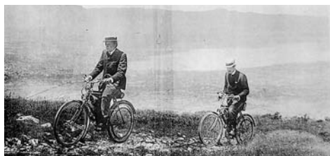
Affiche de la Motosacoche des Frères Dufaux