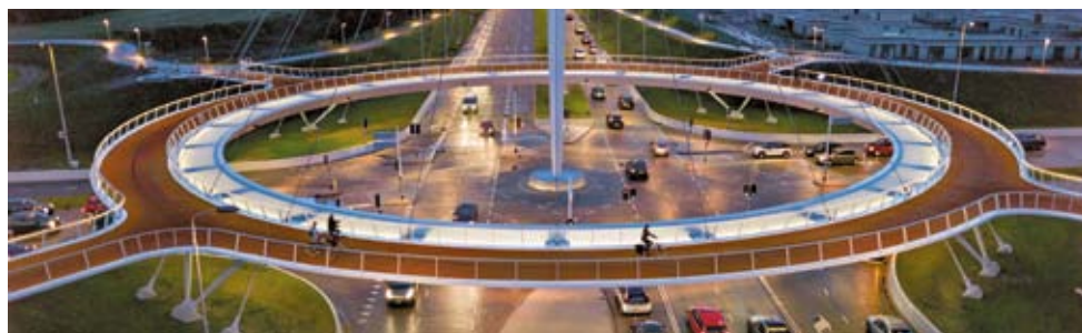
Rond-point aérien cyclable à Eindhoven : Genève n'est pas prête à concurrencer les villes bataves

La question relève évidemment de la boutade. Cependant, après avoir entendu l'Ambassadeur des Pays-Bas, lors du Festival du vélo le 14 avril aux Bastions, j'ai été conforté dans cette conviction qu'il est dans l'intérêt des automobilistes de promouvoir l'usage de la bicyclette. Bien sûr! Plus de gens à vélo, c'est moins d'autos dans les rues de la ville, donc moins d'encombrements! La réalisation d'aménagements urbains serait simplifiée. Et par conséquent, cela soulagerait les finances des collectivités publiques.