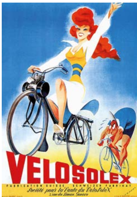
Affiche publicitaire Vélosolex (1951)

Péclôt 13 fonctionne toujours en autogestion !