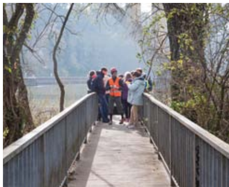
Vélo-tour au fil du Rhône